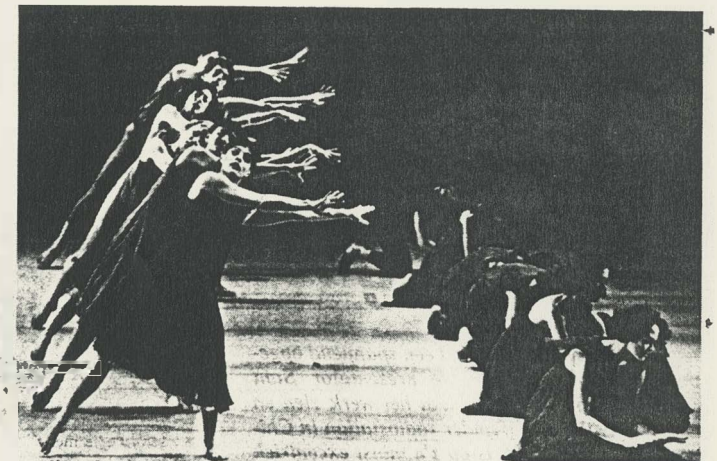
'Het blijft allemaal oppervlakkig, soms glad naast de kwestie of totaal onbegrijpelijk.'