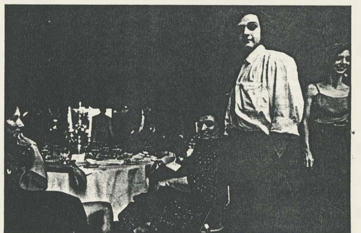
De danseres, de lerare die Morris zijn eerste pasjes deed huppelen toen hij negen was en de choreograaf himself, na afloop van de première.