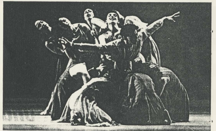
Händel-ballet: 'Af en toe enkele beklievende beelden.'